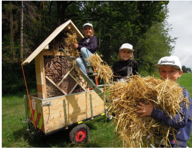
Wochenprojekt: Insektenhotel im Zeltlager 2019